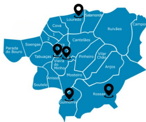
Fig. 2 - Mapa dos equipamentos escolares